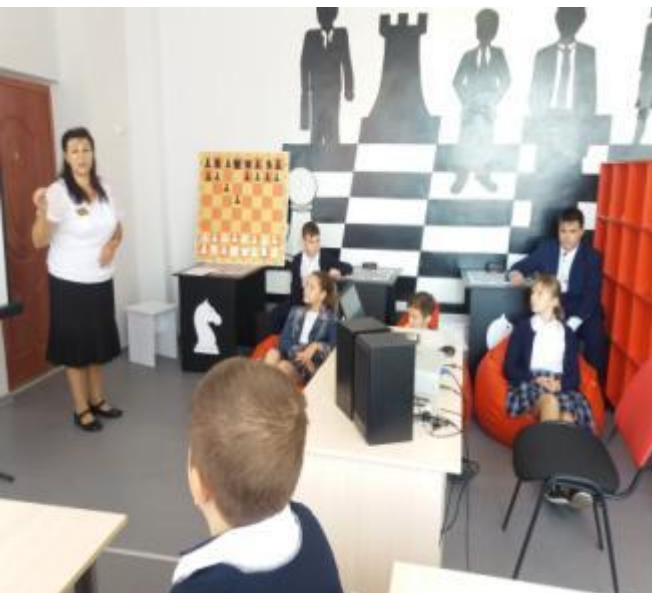
Сентябрь 2019г. – декабрь 2019г. Проведение занятий «Юный шахматист в «Шахматной гостиной»