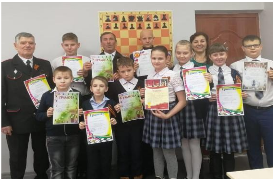
«Шахматная гостиная» - современный, комфортный, оборудованный кабинет с зоной коворкинга