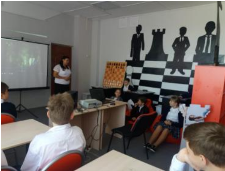
Участие во Всероссийском шахматном турнире на кубок РДШ 17.02.2020г.