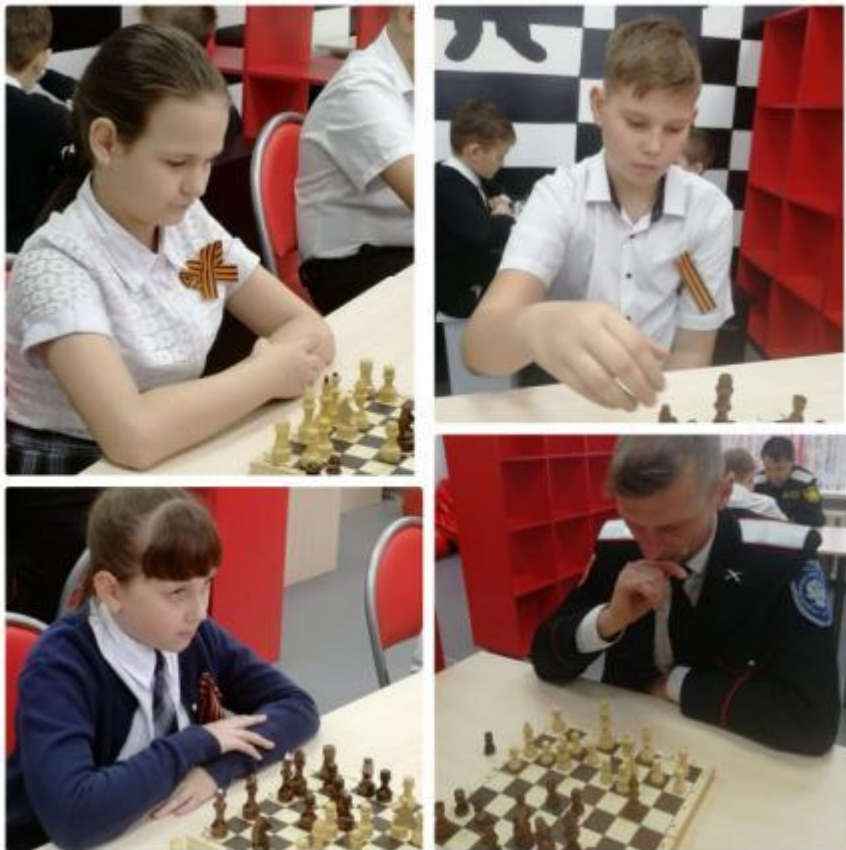
Торжественное открытие центра цифрового и гуманитарного профиля «Точка роста» в МБОУ СОШ №55