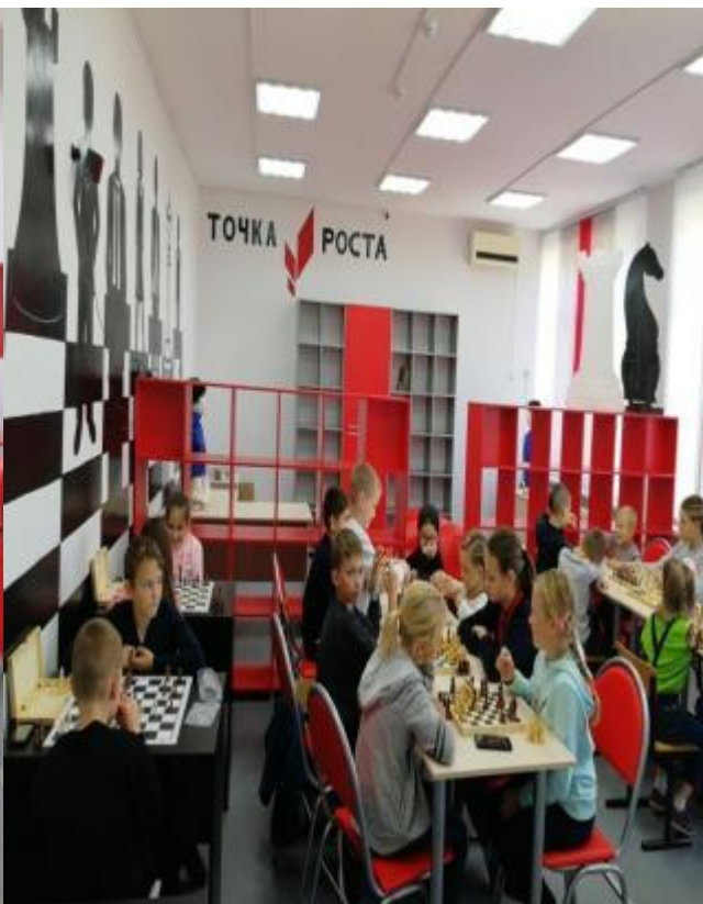
Награждение победителей в школьном этапе Всероссийского турнира по шахматам на кубок РДШ