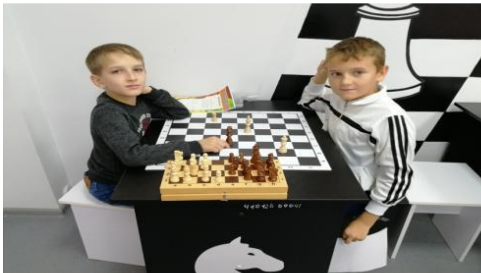
Шахматный турнир среди 1-10 классов (школьный этап Всероссийского турнира по шахматам на кубок РДШ) 02.12.2019г. – 13.12.2019г.