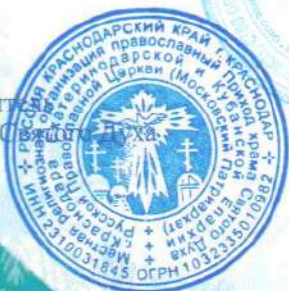
протоиерей Сергий (Лопасов)